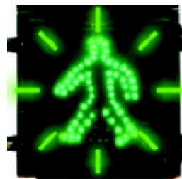
ပုံ ၁၆၀ (ခ)

ပုံ ၁၅၉ သည် လူမတ်တတ်ရပ်နေပုံ မီးနီပြစဉ် လမ်းဖြတ်မကူးရ။