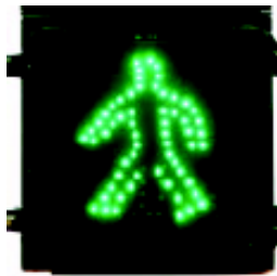
ပုံ ၁၆၀ (က)