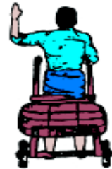
ပုံ ၁၂၈ ဆွဲလှည်း