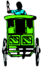
ပုံ ၁၂၅ မြင်းလှည်း