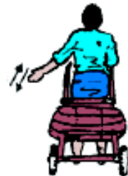
ပုံ ၁၃၂ ဆွဲလှည်း