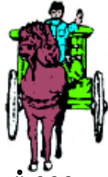
ပုံ ၁၃၃ မြင်းလှည်း