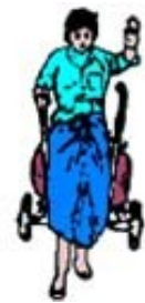
ပုံ ၁၃၆ ဆွဲလှည်း