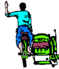
ပုံ ၁၂၆ ဆိုက်ကား