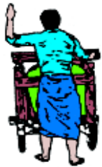
ပုံ ၁၂၇ တွန်းလှည်း