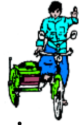
ပုံ ၁၃၄ ဆိုက်ကား