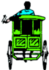
ပုံ ၁၂၉ မြင်းလှည်း