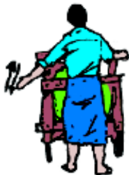
ပုံ ၁၃၁ တွန်းလှည်း