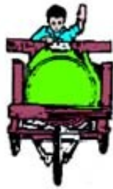
ပုံ ၁၃၅ တွန်းလှည်း