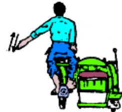
ပုံ ၁၃၀ ဆိုက်ကား